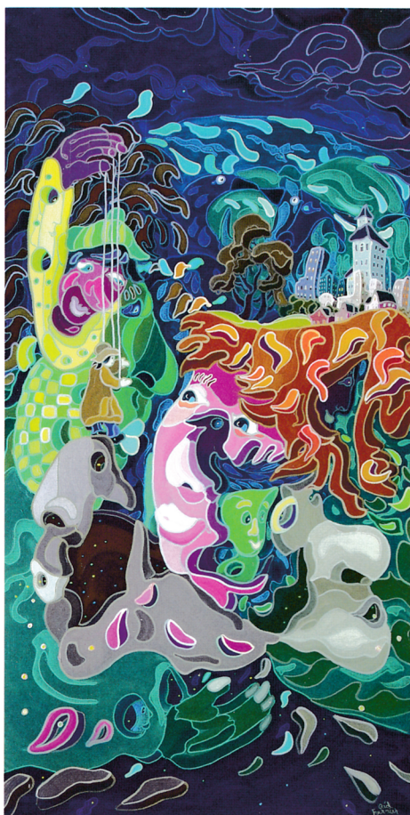
« Libérons-nous dans la lumière/Let Us Free Ourselves In The Light », huile, 41 x 28 po.