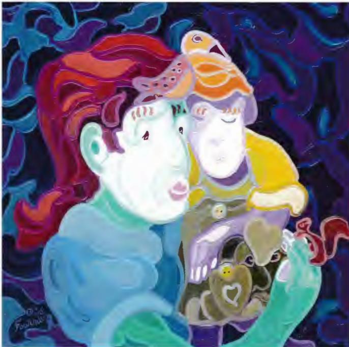
« SWEET TENDERNESS/Douce tendresse », oil, 24 x 24 in.

his lines with his eyes closed. In the morning, he sat down with paper and pencil, closed his eyes and said to himself, "This is who I am today," and started to draw random intersecting lines. Turning the paper this way, then that way, he found an image and developed it into a painting. This style would become his trademark.