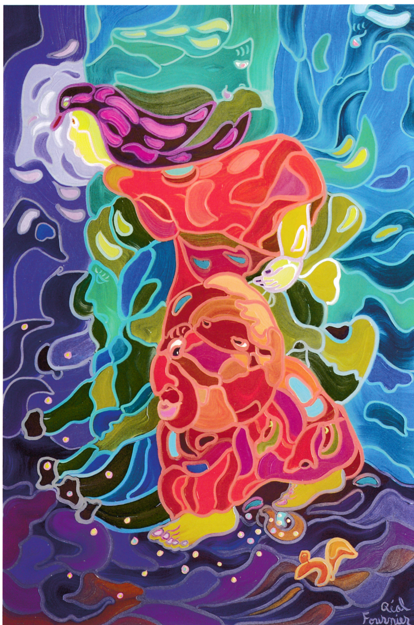
« La force de la vie dans la nature /Nature Life Force », huile, 41 x 28 po.