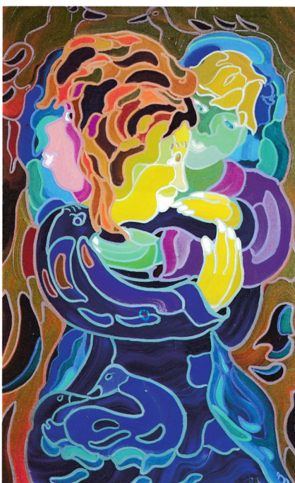
« Les amoureux/Lovers », huile, 40 x 24 po.

plonge dans le tableau. Cet incroyable résultat est le fruit d'une vingtaine d'années d'efforts et de recherches.