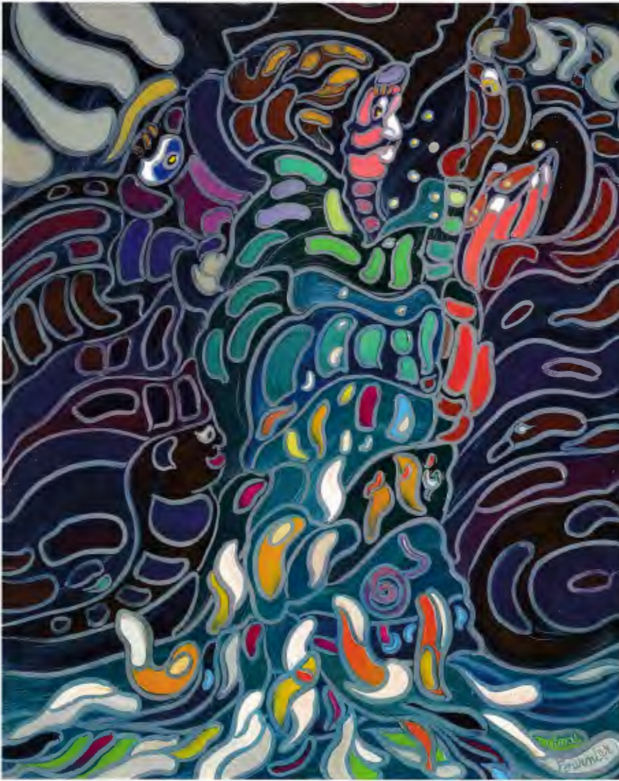
« SHARING THE LIGHT », oil, 30 x 24 in.