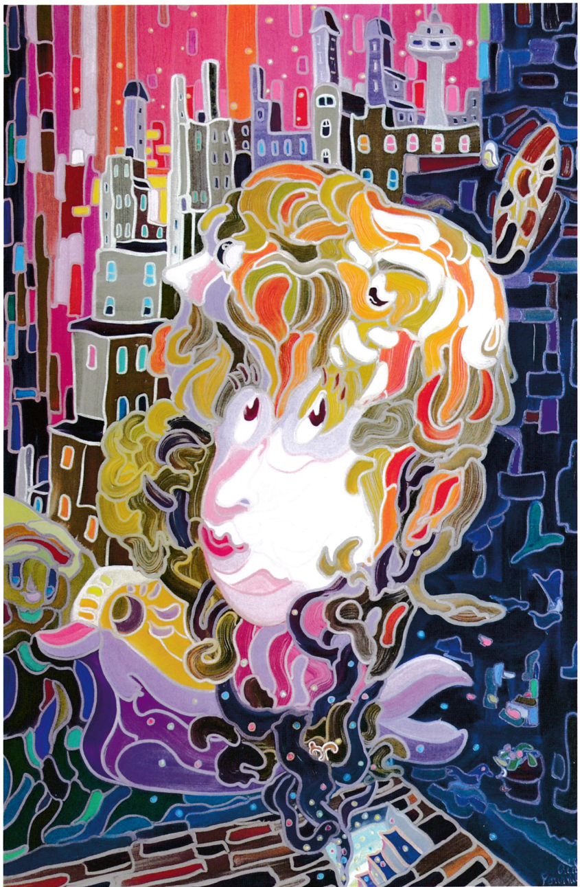
« Le lien/The Link », huile, 60 x 40 po.

Alors qu'il était adolescent, Fournier avait déjà participé à un test d'aptitude en art, dans lequel les élèves devaient gribouiller des lignes qui s'entrecroisaient. Ils étaient ensuite invités à trouver des formes dans ces tracés et à les développer. On le répète, Réal est un homme à l'écoute de ses rêves. Il en fit un autre dans lequel on lui disait de reprendre cette approche au niveau de son art et de dessiner les lignes les yeux fermés. Le lendemain matin, il s'est assis devant une feuille de papier avec son crayon, puis il a fermé les yeux et s'est dit : « Voici qui je suis aujourd'hui » et il a commencé à dessiner des lignes qui s'entrecroisaient. Suite à cet exercice, il trouvait des images intéressantes dans ses formes et les développait en tableaux. Cette façon de faire est devenue sa signature personnelle. Une autre technique que Fournier utilise est la réalisation de camaïeux de plus petites