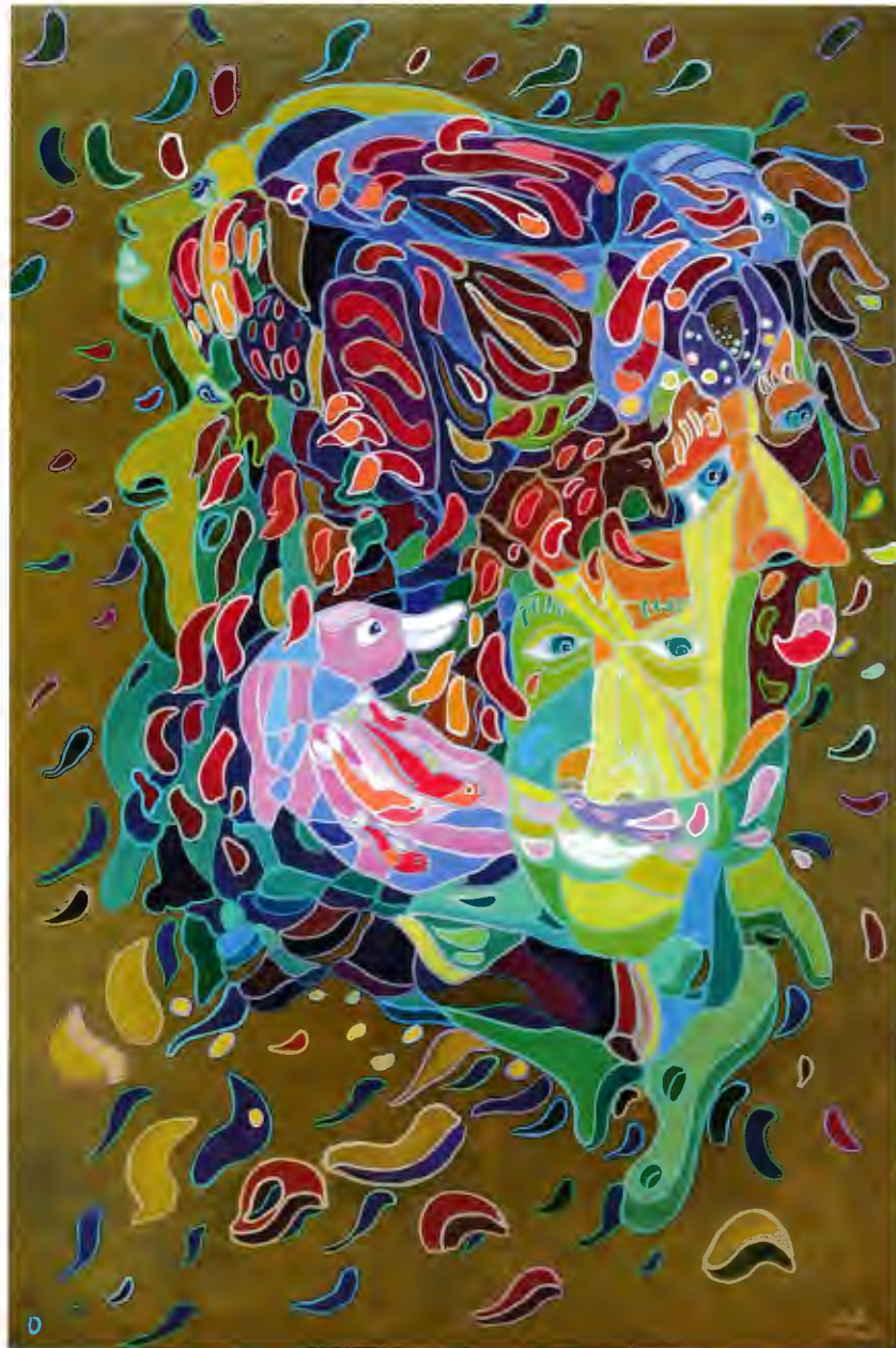
« ONE WITH THE LIGHT », oil, 75 x 48 in.