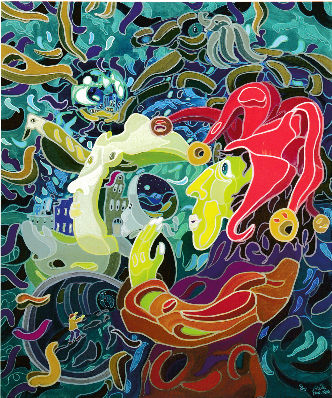
« Le voyage révélé/The Journey Revealed », huile, 60 x 48 po.

dimensions que les tableaux de sa technique dite des yeux fermés. En d'autres mots, il emploie des tons différents d'une même couleur. Il crée donc des scènes monochromes qui dégagent des ambiances uniques. Puis il utilise ensuite une palette restreinte pour compléter l'œuvre.