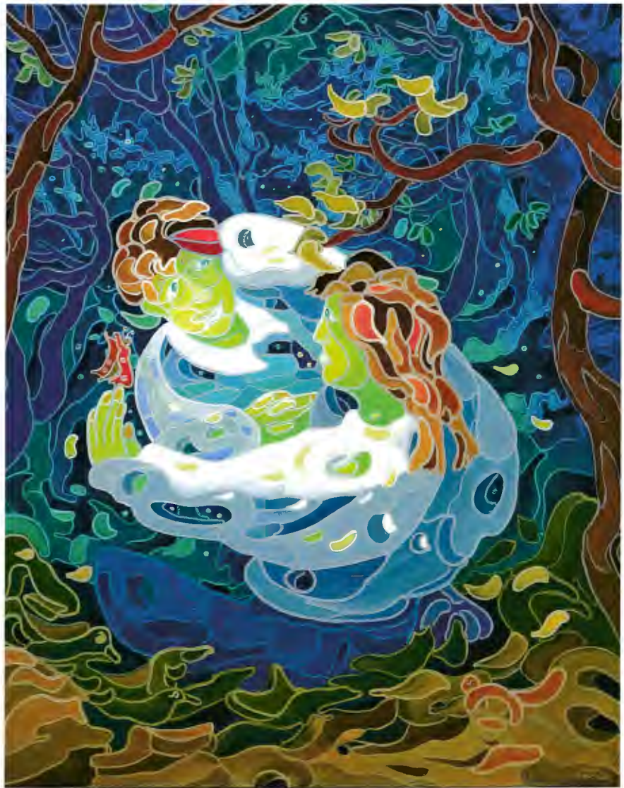
« INFINITE EMBRACE/Enlacement à l'infini », oil, 60 x 48 in.